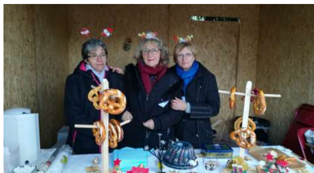
Stand du comité au marché de Noël

Le Foyer Rural, l'Association des Commerçants et Artisans, l'Association des Parents d'Elèves l'Apel de l'Ecole de la Présentation, l'Association des Parents d'Elèves du Sou de l'Ecole Publique, l'Association Ensemble pour Peyre en Aubrac, les Jeunes Agriculteurs, L'Association Tiffany Sport, Cheval de Cœur, Gévaudan Vélo et l'Ecole Forestière de Javols se sont donc joints au Comité des Fêtes pour organiser ensemble cette manifestation sur le village. De plus quelques volontaires spontanés se sont proposés.