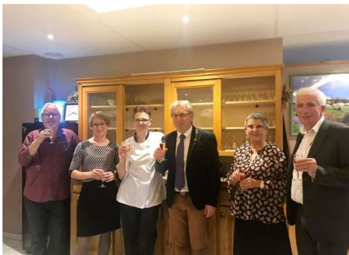
Repas du CCAS