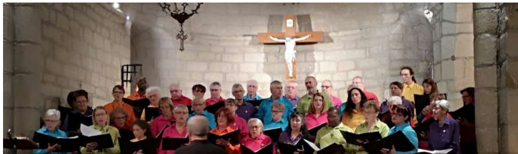
Concert de Noël à Aumont-Aubrac