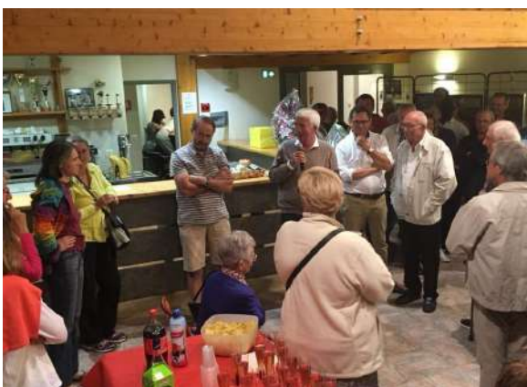
30 ans de la chorale à Javols