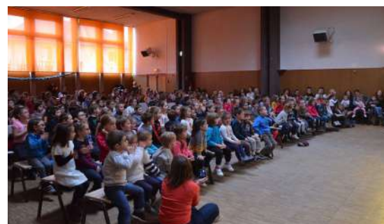
Spectacle de Noël

Comme chaque année, le Foyer Rural a offert aux enfants scolarisés sur la commune et à ceux en garde chez les assistantes maternelles un spectacle au centre socio-culturel d'Aumont-Aubrac. 200 enfants ont ainsi pu profiter d'une représentation de la compagnie « Bonne Pioche », deux artistes clowns-jongleurs qui ont ravi petits et grands. L'après-midi, les élèves des écoles d'Aumont-Aubrac ont participé à la décoration du sapin installé sur la place de la Mairie. Accueilli dès le matin par M. le Maire, ils ont pu échanger autour du thème de la citoyenneté.