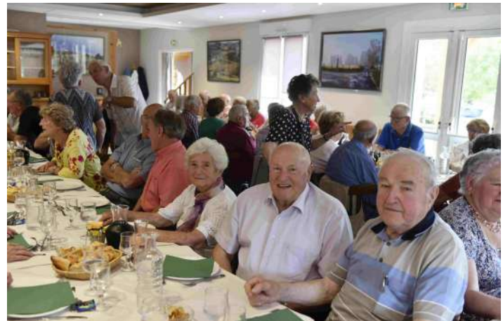
Repas Génération Mouvement