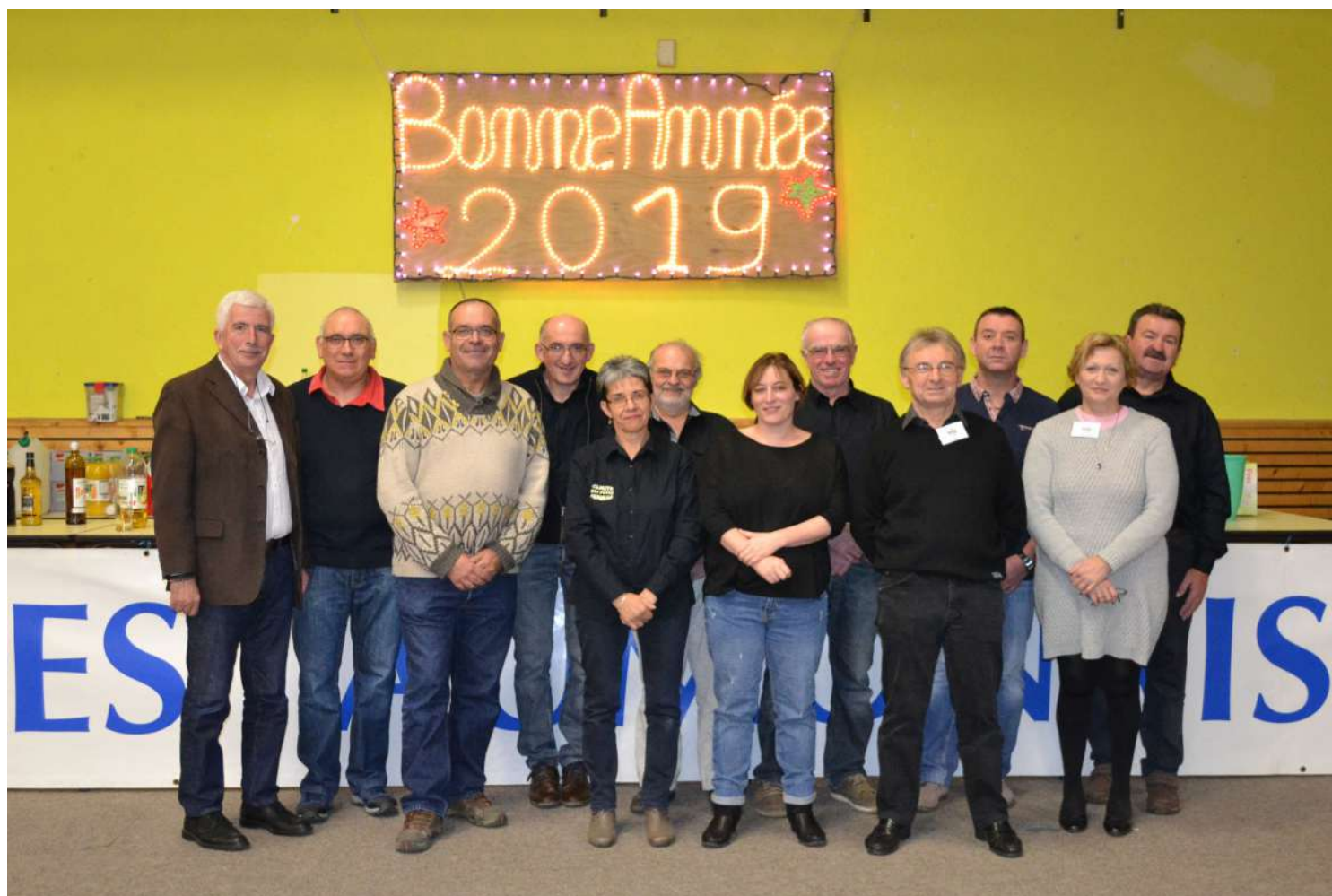
Le comité des fêtes aumonais

Vous pouvez également vous-mêmes proposer vos bons souvenirs ou photos des animations sur l'adresse mail du comité : « cdf.aumonais48@gmail.com »