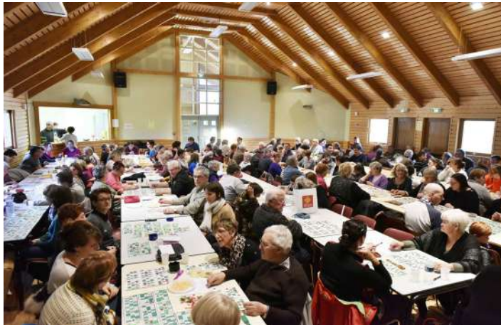
Loto de l'école publique