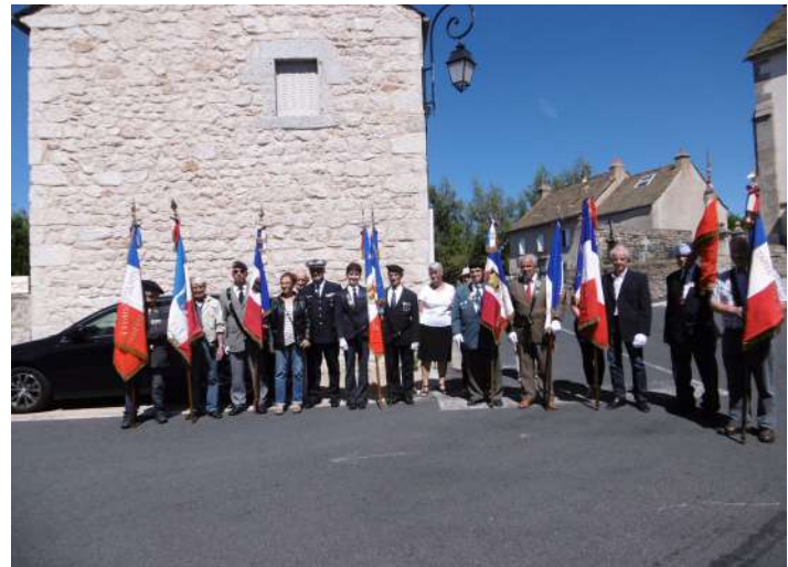
Souvenir Léon Marquès