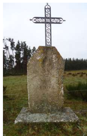
Croix des Souchèiro