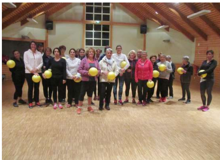
Reprise des activités du club de Gym