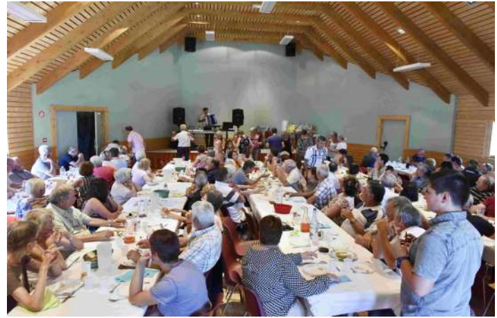
Repas fête du village