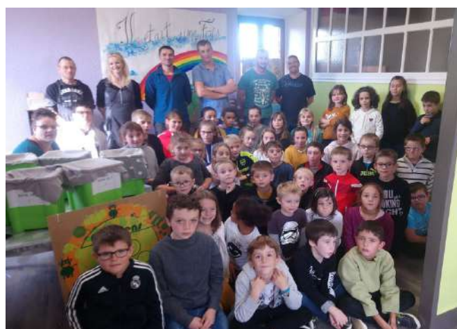
Visite des Jeunes Agriculteurs