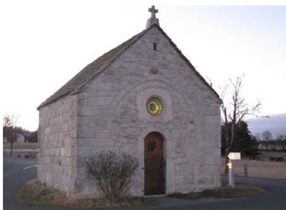
La chapelle de Lasbros et sa rosace

Comme chaque année, le colis de Noël a été distribué aux personnes âgées sans oublier nos résidents en maison de retraite.