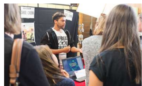
Forum des activités

Une vingtaine d'associations sont ainsi venues présenter leur discipline et ont proposé des démonstrations qui ont su attirer le public.