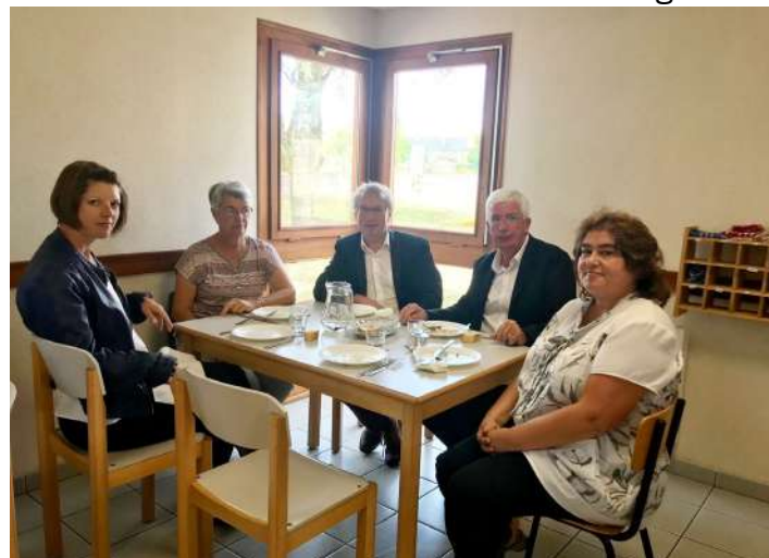
Repas des élus à la cantine