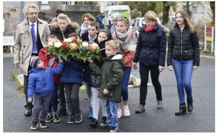
Cérémonie 11 novembre