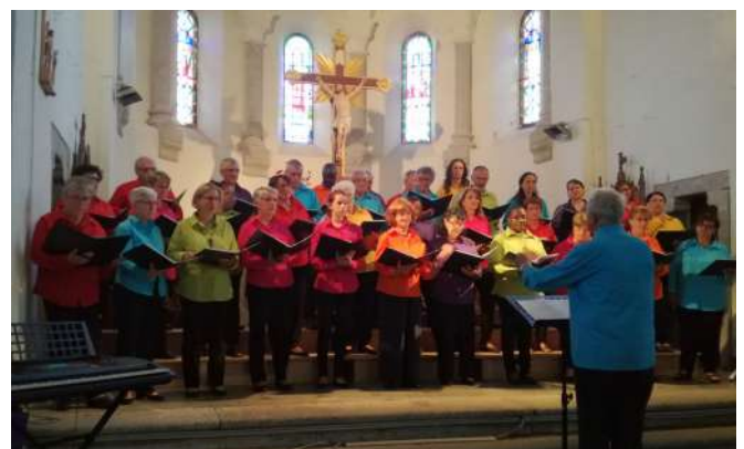
30 ans de la chorale à Javols