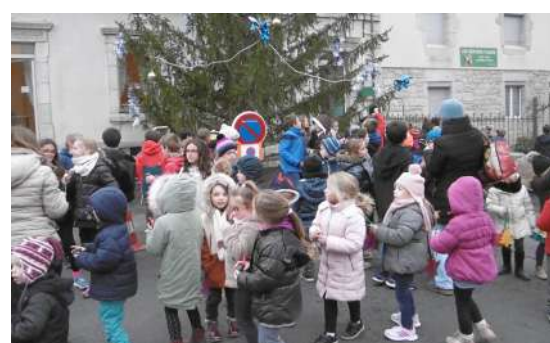
Les enfants à la Mairie d'Aumont-Aubrac.

Les inscriptions pour les sessions de ski sont lancées ! Elles auront lieu du 25 février au 1 er mars et du 4 au 8 mars. Pour vous inscrire, vous pouvez télécharger le bulletin sur le site de Peyre en Aubrac ( peyreenaubrac.fr > page Foyer Rural) ou au bureau du Foyer à la Maison de la Terre de Peyre (du mardi au jeudi de 14h à 17h45, le vendredi de 14h à 15h30).