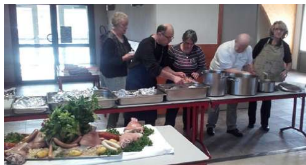
Choucroute à Javols

Du Fau de Peyre à Saint Sauveur mais aussi à Javols pour la choucroute, nous avons eu droit à de jolies rencontres amicales ; le 2ème mini-loto a également obtenu un beau succès et sera reconduit au printemps prochain.