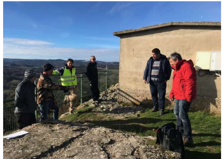
Réunion d'ouverture du relais 4G