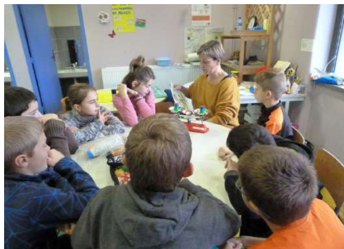
Journée prévention santé