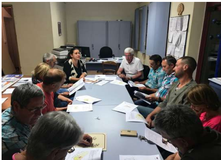
Présentation Maison des associations et de la chasse