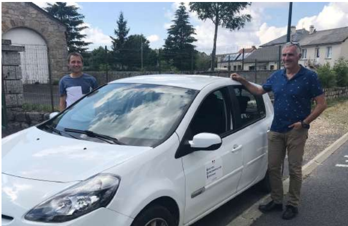
Mission assistance DDT