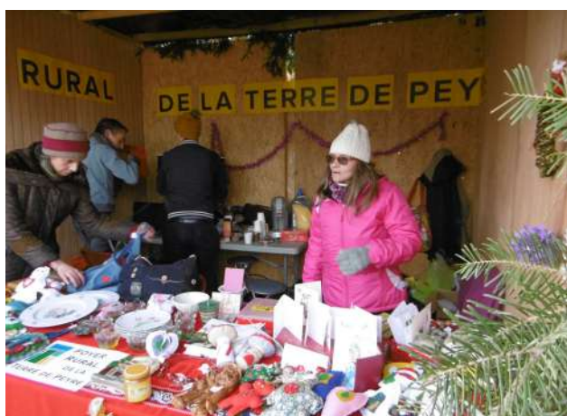
Stand du Foyer Rural au marché de Noël

Le 15 septembre, à l'occasion du 30 ème anniversaire de la chorale Terre de Peyre, un concert a été donné à l'Eglise de Javols. Choristes et membres du Foyer se sont ensuite retrouvés à la salle des fêtes de Javols pour un apéritif-dinatoire placé sous le signe de la convivialité.