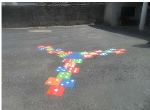
Embellissement de la cour