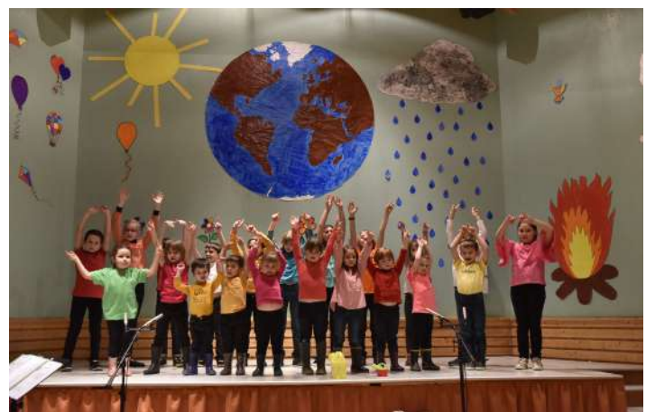
Spectacle de l'école publique