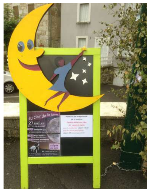
Soirée astronomie le 27 juillet