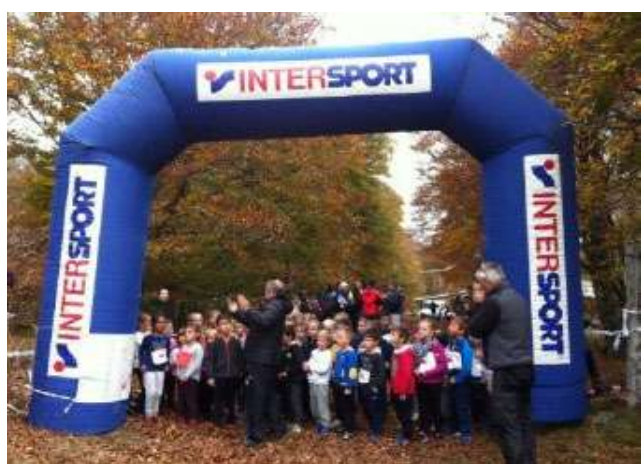
Cross à Nasbinals

Fin décembre, l'école a organisé dans le cadre du marché de Noël un atelier créatif au centre socio-culturel d'Aumont-Aubrac.