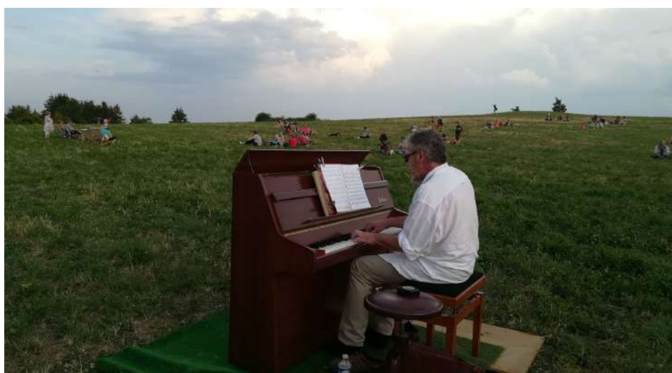
Soirée astronomie le 27 juillet

L'association a de nouveaux projets pour cette année 2019, notamment avec un événement prévu dans le mois de juillet, où de multiples animations et découvertes seront au rendez-vous.