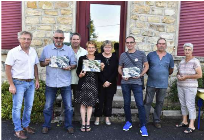
Remise des récompenses jeu site Internet